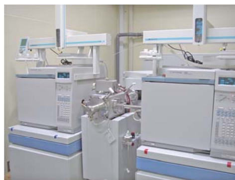
● 高分解能ガスクロマト質量分析計 (ダイオキシン類分析用)