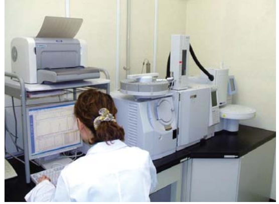
● ガスクロマトグラフ質量分析装置(GC/MS)