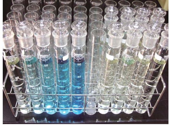
● 有害物質の分析(シアン化合物)