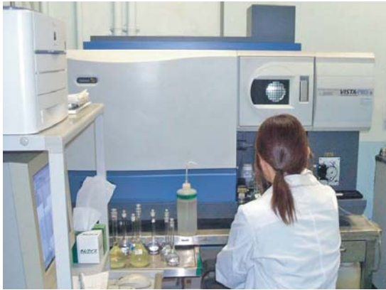
● 誘導結合プラズマ発光分析装置(ICP-AES)