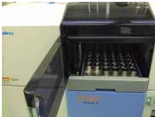
● サンプラーセット

蛍光 X 線分析により検出される全てのピークを解析し、理論値に対する相対強度から元素成分を定量します。