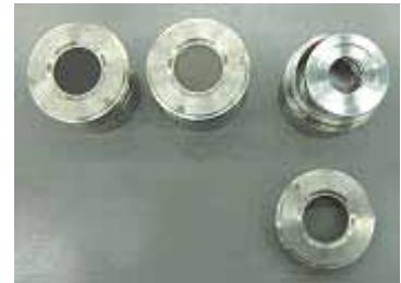
● 試料ホルダー装着

蛍光 X 線分析により検出される全てのピークを解析し、理論値に対する相対強度から元素成分を定量します。