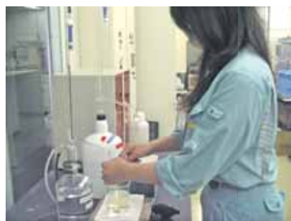
● 主成分の定量分析(容量分析)