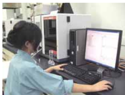
● 機器による微量元素の分析