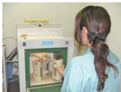
● マイクロウェーブ装置による試料の前処理