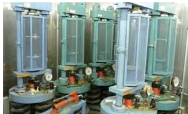
●クリープ試験状況

持続荷重を受け続けると、時間の経過とともにクリープひずみを測定します。 \phi 100 \times 200\text{mm} 用 (200kN タイプ 15 セット) と \phi 150 \times 300\text{mm} 用 (500kN タイプ 6 セット) があります。