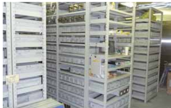
●乾燥収縮供試体保管状況

JCI「収縮問題検討委員会」では、年1回程度の乾燥収縮の測定が推奨されています。弊社ではコンクリートの乾燥収縮試験 (JIS A6204 および JIS A 1129-2) の、ISO/IEC17025 の登録事業者となっており、JIS Q 17025 JNLA 標章付き試験報告書を発行することができます。