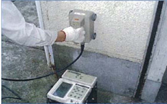
測定機器仕様(ハンディサーチ/日本無線株)