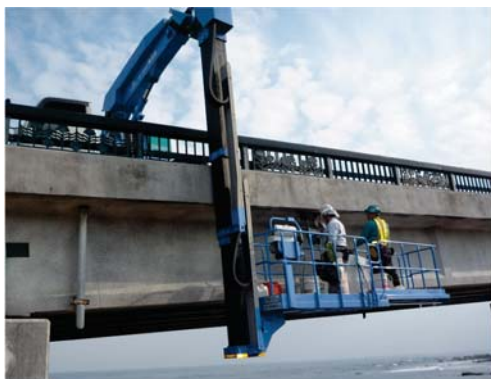
●点検車による作業状況