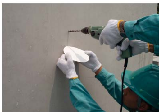
●ドリル法による中性化試験