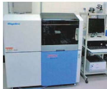
蛍光 X 線分析装置