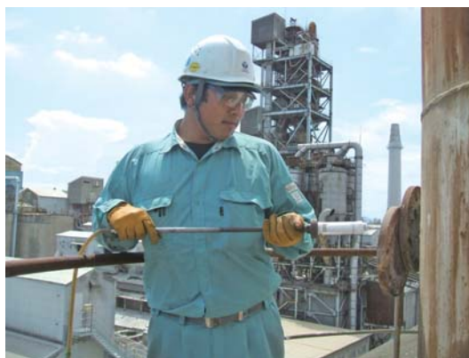
● 煙道排ガスと排出口での測定状況