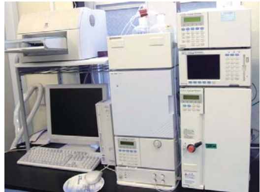
● イオンクロマトグラフ分析装置