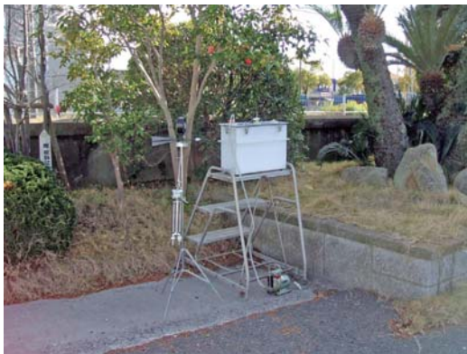
● 敷地境界における捕集状況