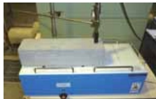
●相対動弾性測定状況

水中凍結水中融解(A法)、気中凍結気中融解(B法)のほかに、建築ブロック等の凍結融解試験(ASTM C1262)が実施可能です。