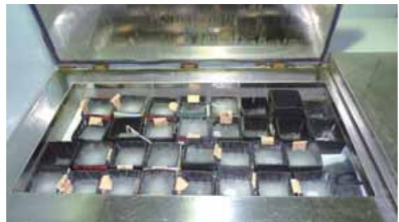
●凍結融解試験状況